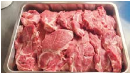
Bei den Kraftsportlern darfs immer etwas mehr sein.

Unser 2. Vorstand hat zum Essen aus dem Dutch-Ofen eingeladen.