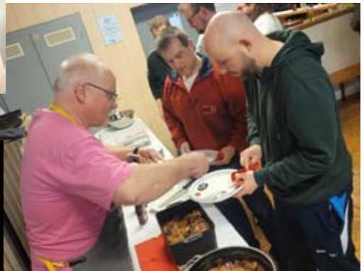
Ein Stimmungsvolles Ende