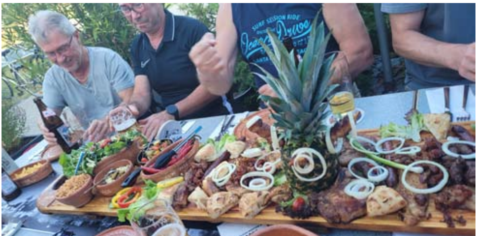
Hungern musste an diesem Abend niemand

Anfang Juli hat die Vorstandschaft zu einem Helferessen in ein Restaurant im Landkreis Kitzingen geladen. Es war eine rundum gelungene Veranstaltung, mit vielen Gesprächen über alle Abteilungen hinweg. So harmonisch kann es in die nächsten 125 Jahre weitergehen.