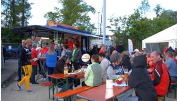
Der Festplatz am Nachmittag

Unser Sommerfest haben wir in diesem Jahr zugunsten unserer 125 Jahr Feier ausfallen lassen. Über unsere überaus erfolgreiche Feier kommt zur Adventszeit ein gesonderter Rückblick heraus der ebenfalls an alle Mitglieder versandt wird.